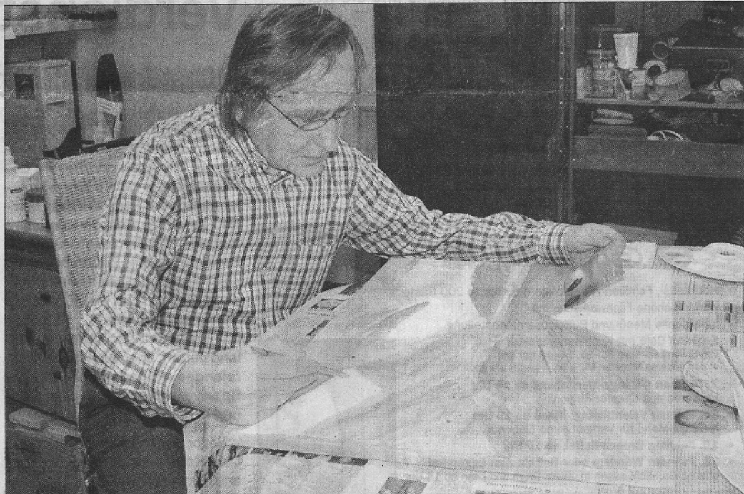
Malen nach Vorlage: Einer der Teilnehmer am „Wandervogel“-Projekt bei der kreativen Arbeit.