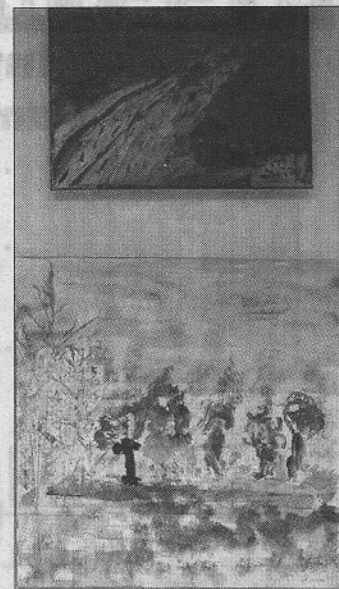
Vor allem Bilder (Foto r.), aber auch Skulpturen (Foto l.) gehören zu den Produkten des „Wandervogel“-Projektes.